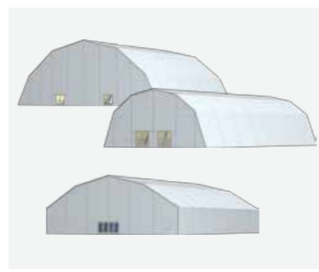
18 m, 30 m, 36 m

Die RÖDER Polygonhalle überzeugt mit einer eindrucksvollen Höhe von bis zu 14 m sowie mit großen Spannweiten von 18 bis 36 m vor allem bei sportlichen Anlässen. Outdoorsportstätten wie Tennisplätze, Schwimmbäder und Volleyball Courts lassen sich problemlos und individuell zu Hallensportanlagen umfunktionieren. Neben drei verschiedenen Spannweiten können auch die Seiten- und Firsthöhen entsprechend der jeweiligen Anforderungen gewählt werden. Ein umfangreiches Angebot an Zubehör wie Schiebe- und Planentore, feste Türen, verschiedene Bodensysteme, Heizungs- und Klimaanlage sowie Beleuchtungssysteme komplettieren das Polygonzelt.