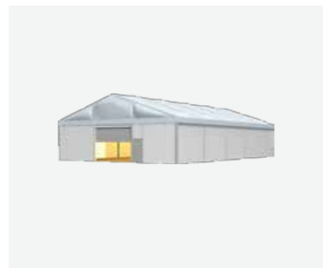
10 m, 15 m, 20 m, 25 m, 30 m, 40 m

Mit flexiblen und modularen Spannweiten, Längen und Höhen passt sich die RÖDER H-LINE individuell den räumlichen Anforderungen an. Durch die dauerhafte Mobilität und ihre durchdachte Konstruktion lässt sich das System im Gegensatz zu traditionellen Hallen schnell montieren und an fast jedem Standort innerhalb kürzester Zeit installieren. Die besondere Bedachung mit doppelwandiger, luftgefüllter Thermodachplane sorgt für optimales Klima, reduziert Heizkosten, verhindert Kondenswasser, verbessert die Schneelast und ermöglicht das Trainieren bei Tageslicht.