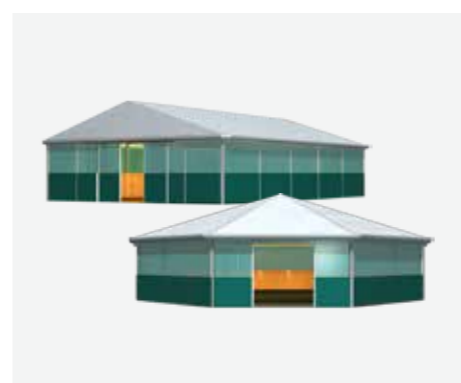
16 m, 18 m, 21 m

Praxisnah und in enger Zusammenarbeit mit Pferdebetrieben und Reitsportveranstaltern hat RÖDER die funktionellen equester Reit- und Longierhallen entwickelt. Die hochwertigen Raumlösungen überzeugen optisch, sicherheitstechnisch sowie wirtschaftlich. Im Vergleich zu konventionellen Reitzelten zeichnen sich die equester Reithallen und Longierhallen durch eine sehr stabile Konstruktion unter Verwendung qualitativ hochwertiger Materialien aus. Sie vereinen Stabilität und Belastbarkeit der massiven Hallenbauweise mit der Flexibilität der leichten Zeltvarianten. Die equester Reit- und Longierhallen ermöglichen den permanenten Einsatz im anspruchsvollen Pferdesport mit der Option, auch nach Jahren noch variabel zu erweitern oder einen Standortwechsel vornehmen zu können. Reiter, Pferdebetriebe und Reitsportveranstalter profitieren gleichermaßen von den vielfältigen Einsatz- und Ausstattungsmöglichkeiten.